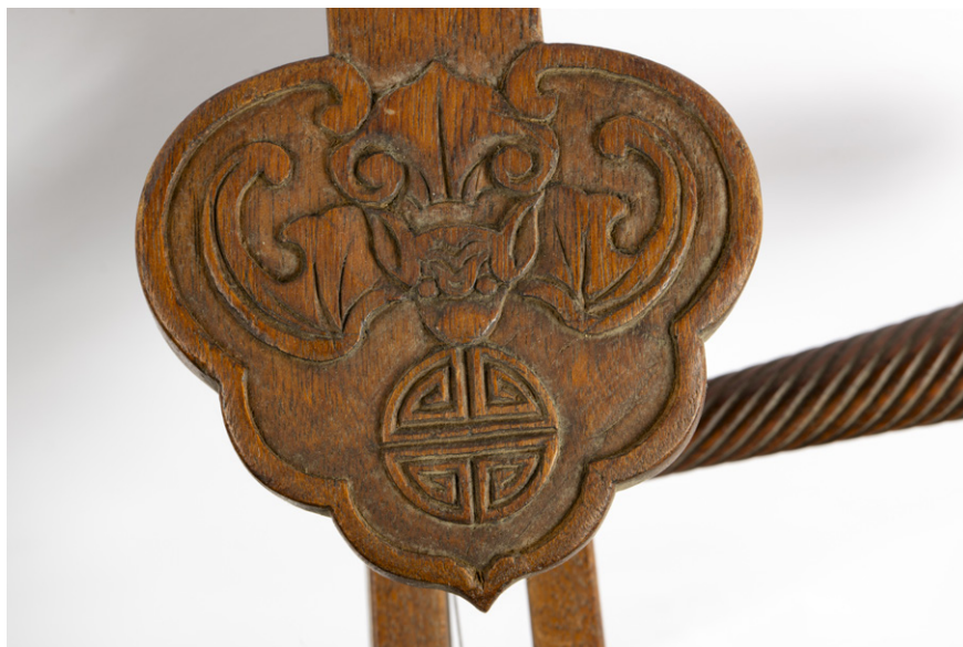
Slika 6: Motiv na glavi inštrumenta z motivom netopirja in simbola shou (Skušškova zbirka, SEM, stara inv. št. NM 18315) (foto: Blaž Verbič, 2022).

inštrumenta pipa z motivom netopirja na glavi tega iz obdobja Ming lahko najdemo v Metropolitanskem muzeju umetnosti (Metropolitan Museum of Art) v New Yorku, tako glasbilo iz obdobja Qing pa hrani Muzej uporabne umetnosti in znanosti (Museum of Applied Arts and Science) v Sydneyju. 32