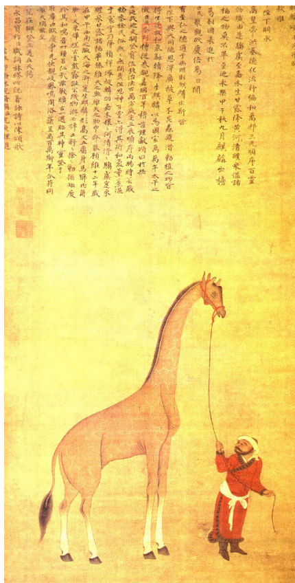
Slika 5: Slika bitja qilin, ki ga je opeval Shen Du (畫麒麟沈度頌), dinastija Ming, približno leta 1414 (Nacionalni palačni muzej, Tajvan).

peljali živo žirafa, ki jo je Yongleju, tretjemu cesarju dinastije Ming, poklonil kralj Bengalije. 22 Žirafa je na Kitajsko pripotovala z ekspedicijo Zheng Heja, velikega morjeplovca iz dinastije Ming, v Jugovzhodno Azijo. Mingovski dvor je poleg žiraf z iste ekspedicije dobil tudi zebre, kadila in različne druge eksotične živali. 23