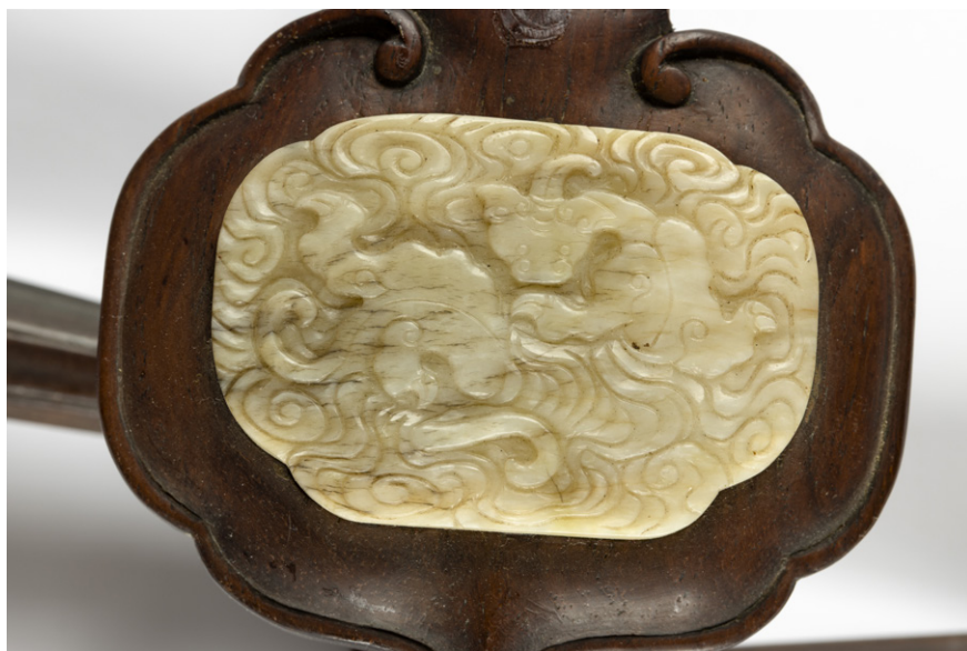
Slika 1: Mitološki qilin , upodobljen na glavi glasbila pipa (Skuškova zbirka, SEM, stara inv. št. NM 18314).

Večkrat so ga zaradi enega roga enačili s samorogom, čemur pa veliko strokovnjakov nasprotuje. 7 Pokrit je namreč z luskami, prav tako je pogosto upodobljen z dvema rogovoma namesto enega, rogovi pa včasih tudi plosko ležijo ob glavi živali in ne štrlijo stran od nje kot pri samorogu. Kot bomo lahko videli pozneje, so ta mitološki lik enačili tudi z žirafo, predvsem takrat, ko so bile te živali prvič pripeljane na Kitajsko.