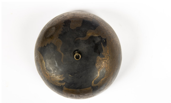
Slika 11: Posamezen bakren viseči zvon z motivom zmaja z vrha (Skuškova zbirka, SEM, stara inv. št. NM 18481).