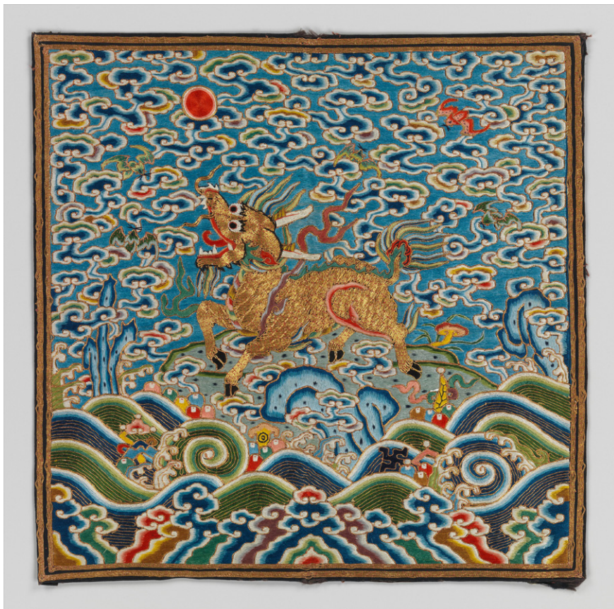
Slika 4: Qilin – vezenina s svilo in kovinsko nitjo na svilenem satenu (19. stoletje) (The Metropolitan Museum of Art).

izročilu pa celo velja, da ne hodijo po travi, ampak lebdijo, da ne bi poškodovale živih bitij in rastlin, prav tako jedo le rastlinsko hrano. 21