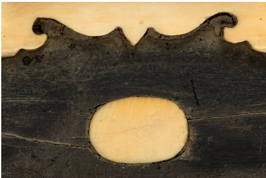
Slika 7: Intarziya iz slonovine v obliki netopirja, ki jo lahko najdemo na obeh inštrumentih pipa (Skuškova zbirka, SEM, stara inv. št. NM 18314).