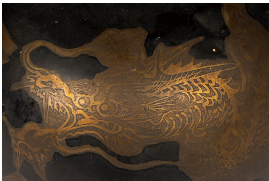
Slika 12: Zmaj kot osrednja ornamentalna okrasitev zvonov (Skuškova zbirka, SEM, stara inv. št. NM 18481) (foto: Blaž Verbič, 2022).