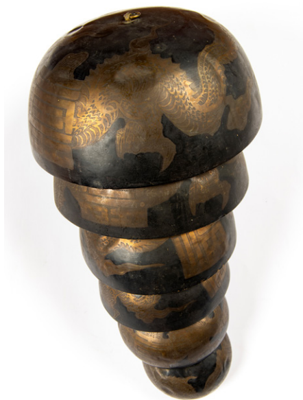
Slika 10: Bakreni viseči zvonovi z motivi zmaja (Skuškova zbirka, SEM, stara inv. št. NM 18481) (foto: Blaž Verbič, 2022).

nov se razprostira klasična podoba zmaja, ki ima dolgo telo v obliki kače, ki mu zlahka sledimo od glave z izrazitimi očmi, tipalkami in repom. Telo je v celoti prekrito z luskami, vidni so tudi močni kremplji, čeprav je težko razločiti, koliko jih je. Motiv zmaja dopolnjujeta dva simbola. Prvi, znak fu (福), ki predstavlja »bogastvo« ali »srečo«, je postavljen pred podobo zmaja. Drugi, znak shou (壽), ki predstavlja »dolgoživost« in ima prav tako kot fu številne mogoče oblike zapisa, je upodobljen čez telo zmaja in postavljen na nasprotni strani znaka fu . Srečenosna motiva v obliki pismenk se pogosto pojavljata skupaj, predvsem v rojstnodnevnih željah, ter poleg znakov lu (祿, »položaj, uspeh, plača in bogastvo«) in xi (喜, »veselje, sreča«) spadata v skupino štirih srečenosnih motivov. 44