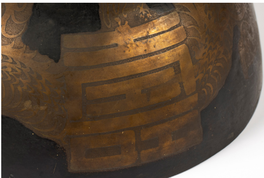
Sliki 13 in 14: Zmaj, upodobljen skupaj s simbolom fu (zgoraj) in simbolom shou (spodaj) (Skuškova zbirka, SEM, stara inv. št. NM 18481) (foto: Blaž Verbič, 2022).