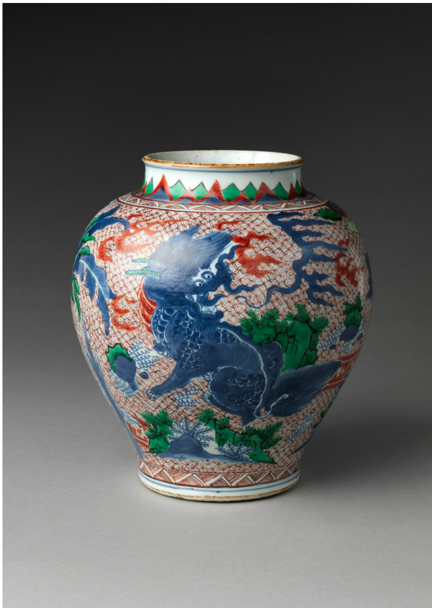
Slika 2: Posoda z mističnim bitjem qilin (17. st.) (The Metropolitan Museum of Art).