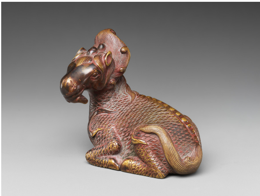
Slika 3: Obtežilnik za papir v obliki bitja qilin iz bronca (15. st.) 19 (The Metropolitan Museum of Art).

Poleg prerokovanja in zaščite vladarjev in modrecev je za te zveri tudi značilno, da zagotovijo prevoz v nebesa in nazaj ter prav tako pospremi- mijo duše plemenitih mož nazaj v nebesa po njihovi smrti. 20 V konfuci- janstvu je krepostna zver, ki je prežeta z najpomembnejšo vrlino – nprav- nostjo ren . Glede na to lastnost so zelo nežne narave, po budističnem