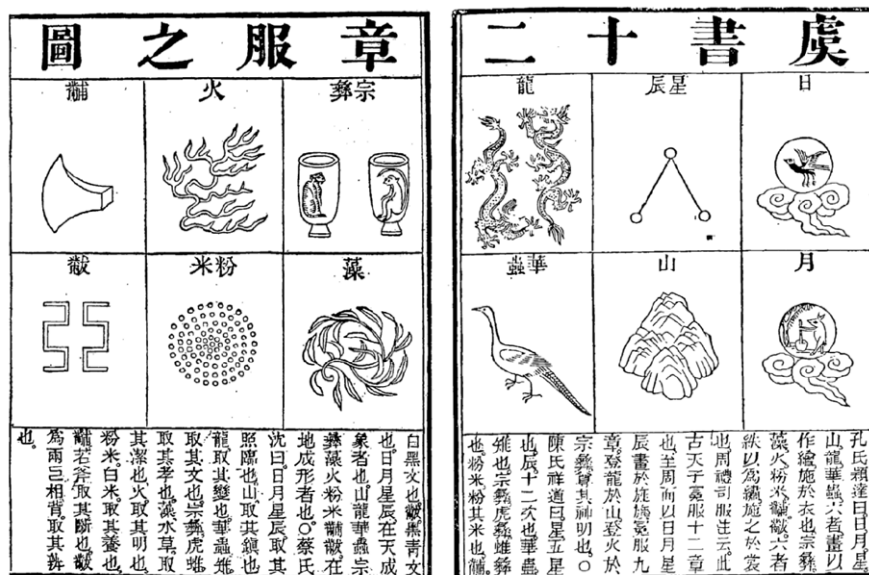
Slika 8: Ilustracija dvanajstih cesarjevih simbolov, ki so dokumentirani v Zapisih velikega zgodovinarja (zgodnje 1. st. pr. n. št.) in med katerimi lahko najdemo zmaja.

simbolov in vzorcev. Ob zmaju so tu še simboli sonca s trinožno vrano (sonce) in lune z luninim zajcem (luna), ki predstavljata dopolnjujoči si nasprotji, zvezde (sreča, blaginja, dolgoživost), gore (stabilnost), fa-zana (prefinjenost in mir), glave sekire (pogum, odločnost, pravičnost), ognja, daritvene skodelice zongyi (predanost in zvestobo), simbola fu (亞), ki ponazarjata dve živali s hrbtom skupaj (sposobnost jasnega razlikovanja med pravim in napačnim), alge (čistost in svetost), in riževega zrnja (hrana, uspešnost).